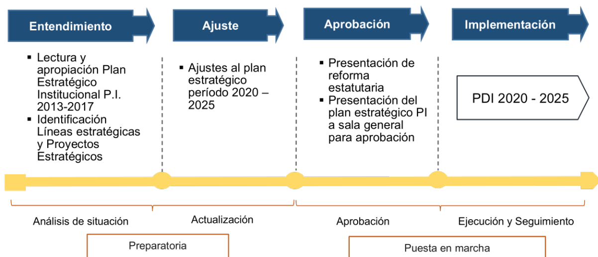
Figura 1. Etapas del Plan de desarrollo Institucional.

La reactivación y reformulación del Plan Estratégico Institucional del Politécnico Minuto de Dios - TEC MD suponía el reto de establecer una carta de navegación que utilizara las capacidades institucionales, las posibilidades de alianza y las oportunidades existentes en el medio para lograr los objetivos propuestos, es así como se buscó ofrecer la mejor opción posible de formación para los futuros estudiantes, en concordancia con las apuestas estratégicas de la misionalidad institucional, las necesidades existentes en el sector productivo y las nuevas realidades esbozadas por el azote de la pandemia COVID-19, evento que enmarcó inesperadamente el resurgimiento de la institución y que según IESALC, (2020) tendrá efectos en el sector educación superior en el corto, mediano y largo plazo. Las etapas comprendidas en este proceso se describen a continuación.